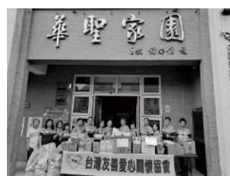
台灣友善愛心關懷協會 大葉大學友善陽光社