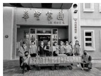
新北市合進慈善協進會