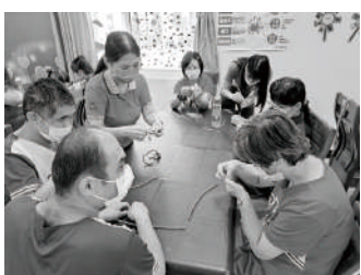
雲林縣女童軍捐贈共融