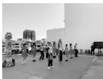
新日建動土-特奧表演