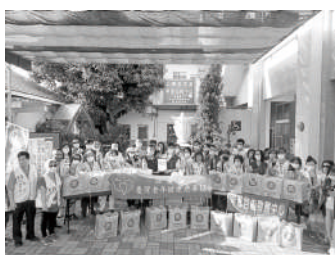
台灣老年健康慈善協會