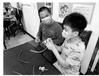
雲林縣女童軍捐贈共融