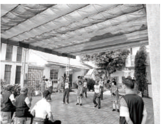
彰化湄洲媽祖慈善會