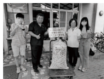
福田社會文化關懷協會